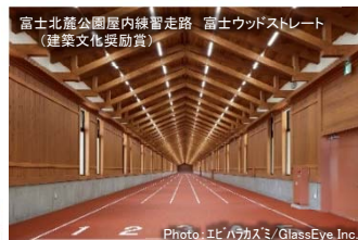
富士北麓公園屋内練習走路 富士ウッドストリート (建築文化奨励賞)