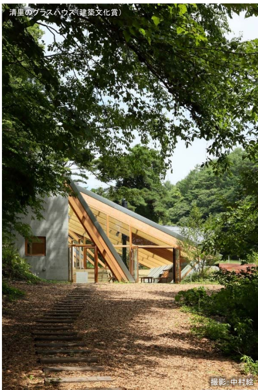
清里のグラスハウス(建築文化賞)

Yamanashi Cultural Prize of Architecture since 1990