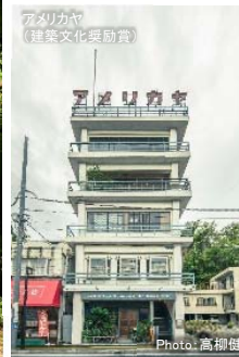
アメリカヤ (建築文化奨励賞)