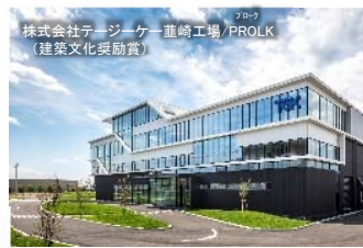
株式会社テージーケー 龍崎工場 / PROLK (建築文化奨励賞)