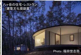
ハツ岳の住宅・レストラン (建築文化奨励賞)